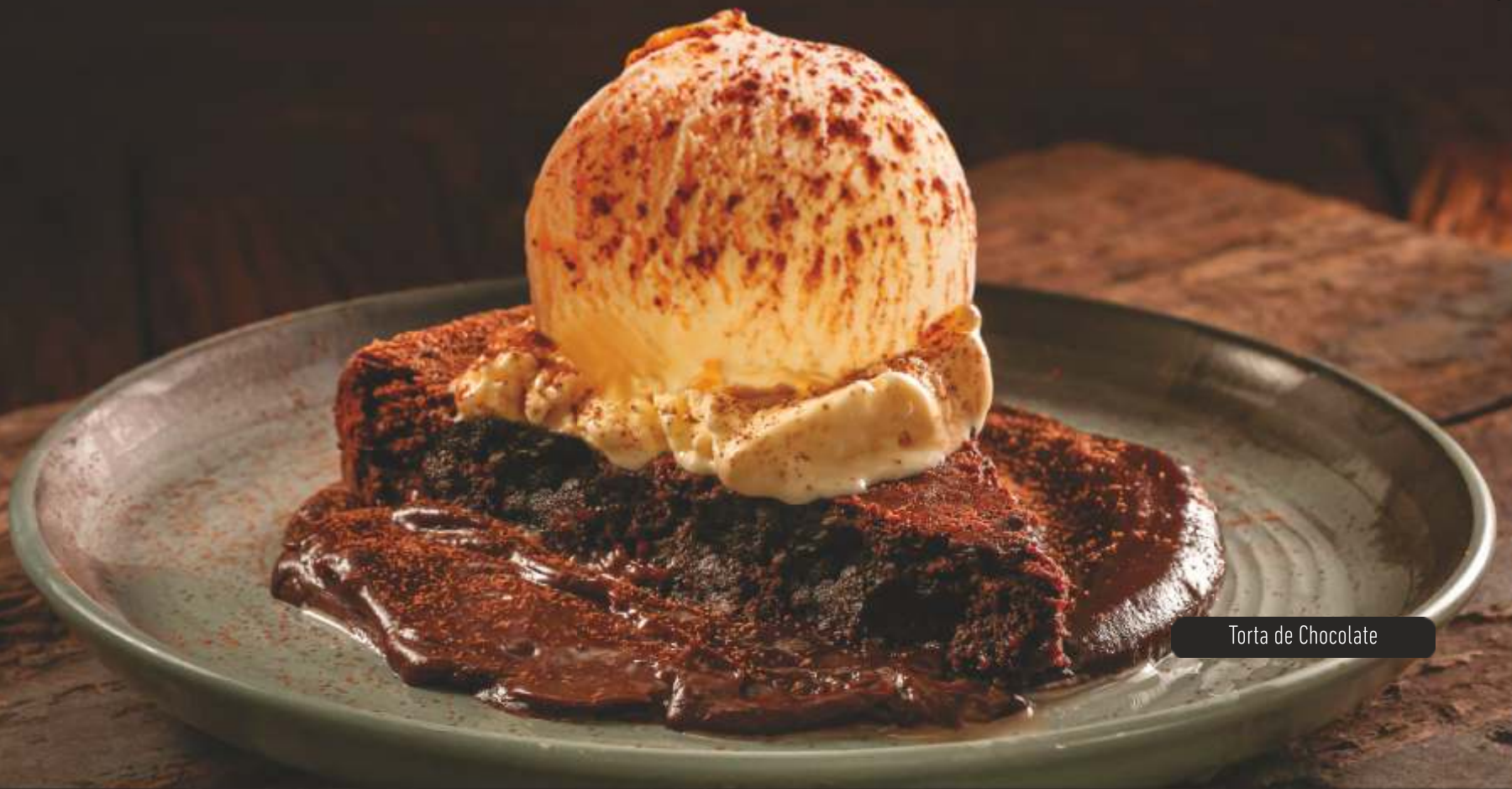
Torta de Chocolate