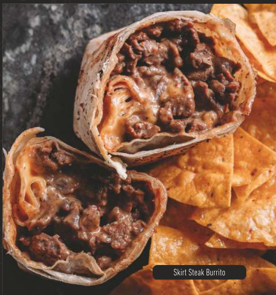
Skirt Steak Burrito

Tortilla de trigo com recheios de sua preferência. Acompanha salsa roja picante, sour cream e tortilla chips.