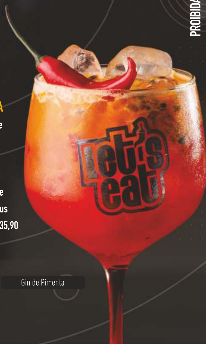
Gin de Pimenta

PROIBIDA A VENDA PARA MENORES DE 18 ANOS. SE BEBER NÃO DIRIJA.